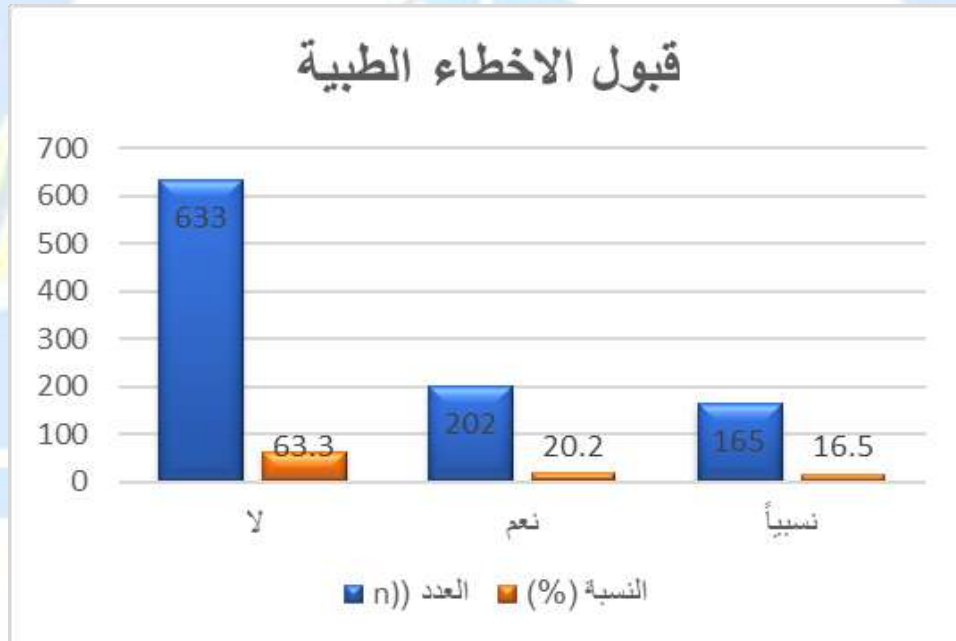
الشكل 2: مدى تقبل الأخطاء الطبية.