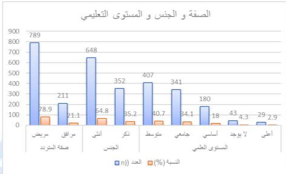
الشكل رقم 1: الخصائص الديموغرافية للمشاركين.